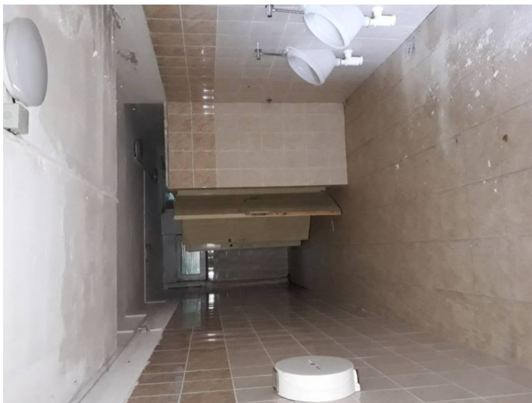
Obr.14: Anglický dvorek v zadní části za toaletami.