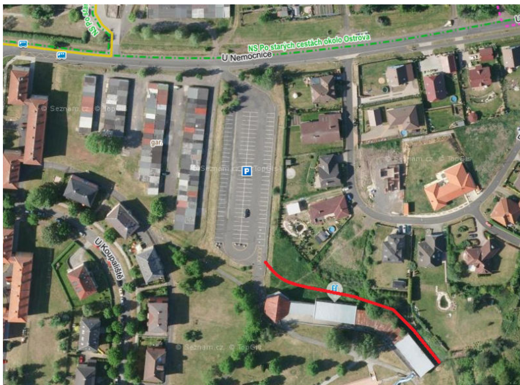
Obr.6: Uliční fotografie - vyznačení příjezdové cesty ze zadní strany areálu (šrafo).