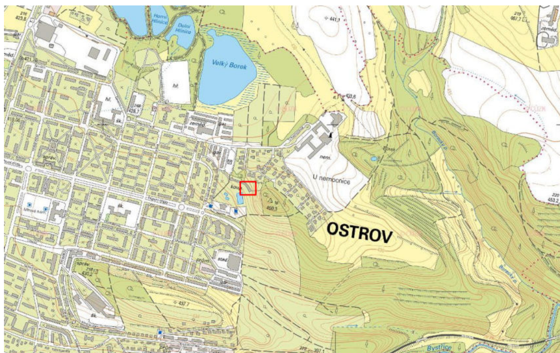
Obr.4: Výřez územního plánu dotčeného území Ostrova s vyznačením stavby (červenou šípkou).