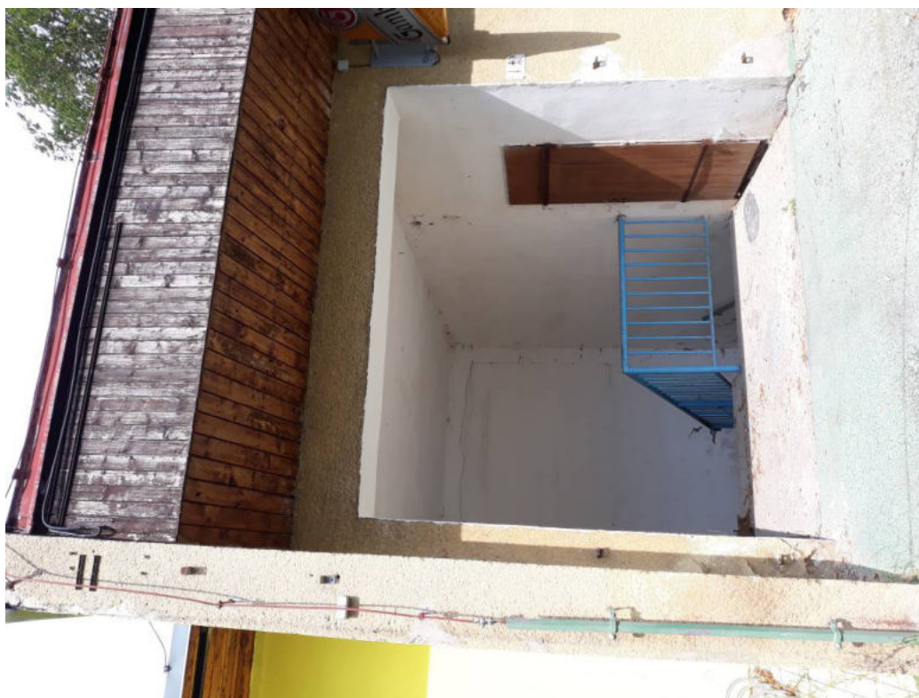
Obr.12: Celkový pohled do objektu skladu – příhradové zastřešení.