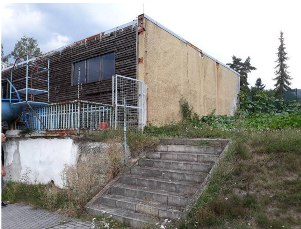
Obr.10: Celkový pohled z V, zadní průčelí skladu.