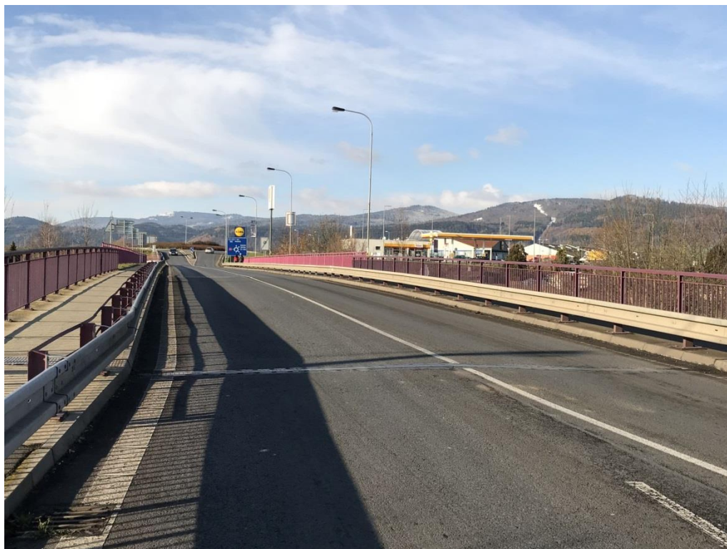
Obr.1 Celkový pohled od opěry 01 (směrem k OC Lidl)