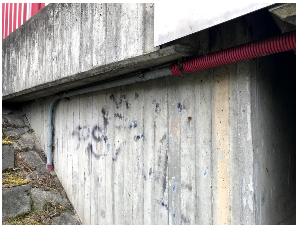
Obr.10 Chránička s kabelem VO vpravo na opěře 01