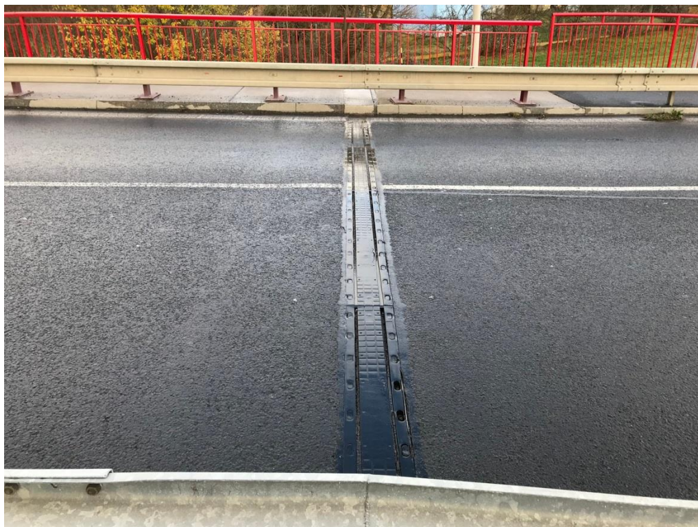
Obr.3 Celkový pohled na MZ na opěře 01