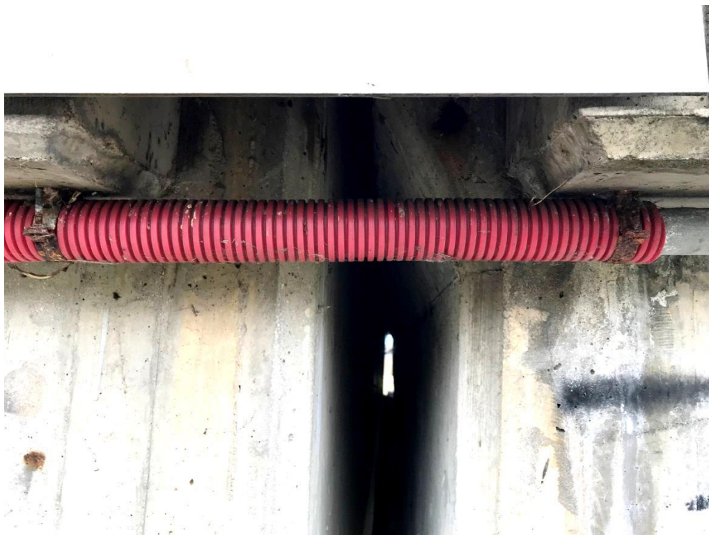
Obr.11 Detail chráničky VO v místě dilatační spáry na opěře 01