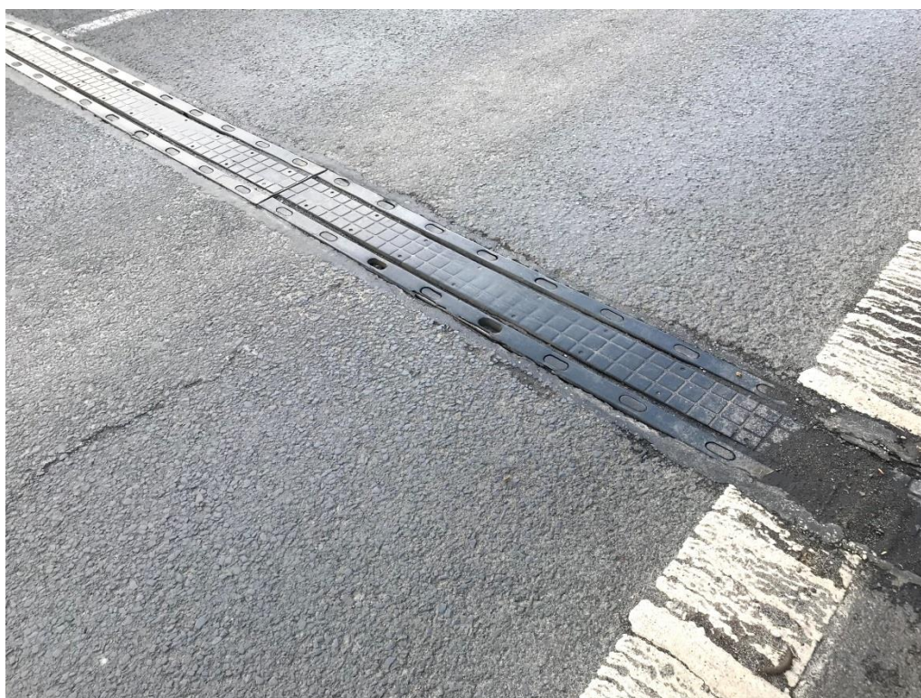
Obr.6 Opěra 01 – MZ – poškozený závěr, trhlina v krytu vozovky