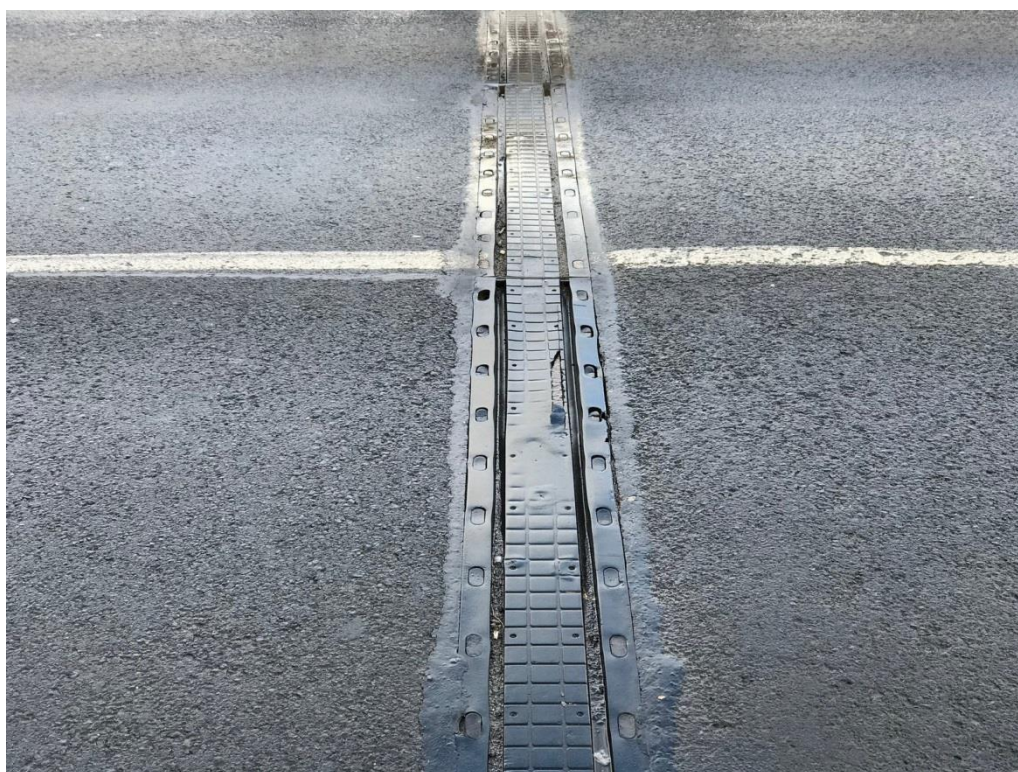
Obr.8 Detail poškození MZ na opěře 02