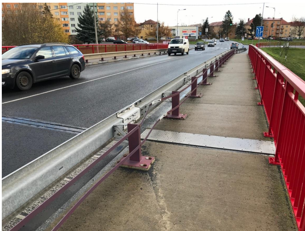
Obr.9 Chodníková část MZ na opěře 02