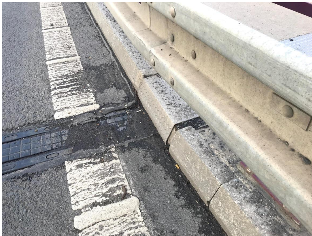
Obr.5 Opěra 01 – MZ – detail u obruby římsy