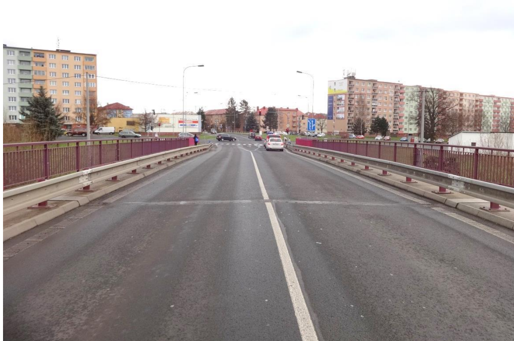
Obr.2 Celkový pohled od opěry 02 (směrem do Ostrova)