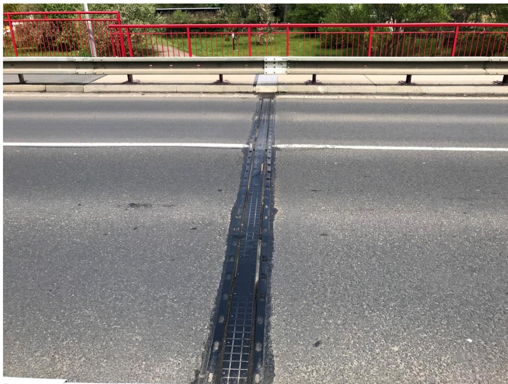
Obr.7 Celkový pohled na MZ na opěře 02